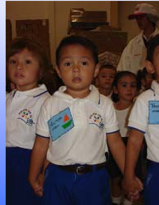
Visita a Planta Industrial Marindustrias 2do. Aniversario de Proinfancia