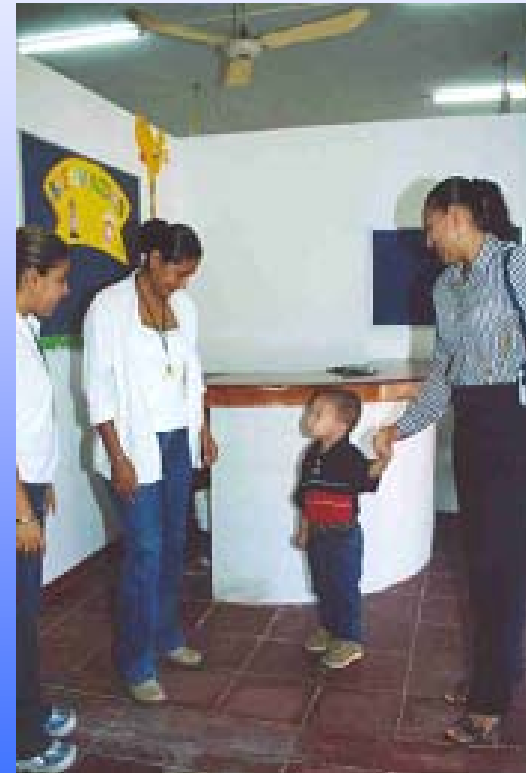
Estancia Infantil Proinfancia de Colima