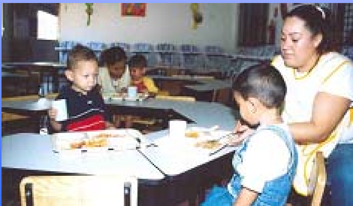
Los Primeros Integrantes Proinfancia de Colima