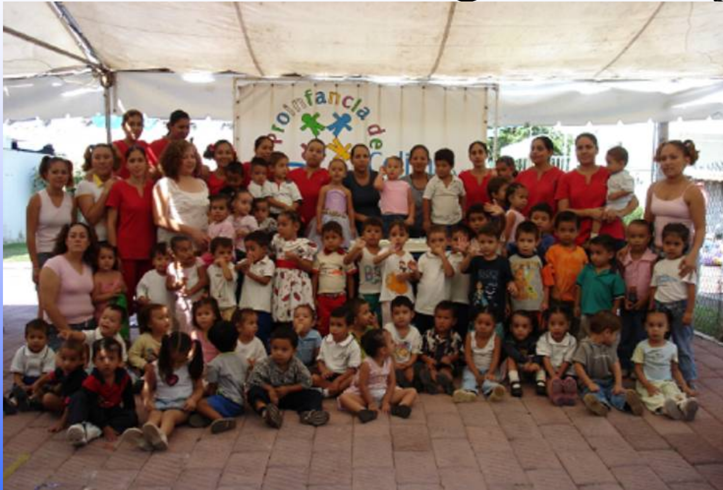
2do. Aniversario de Proinfancia