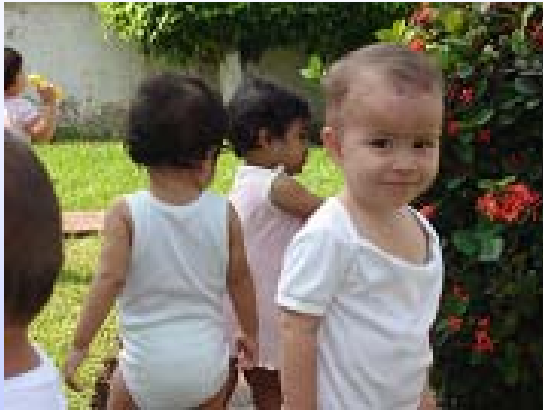
Estancia Infantil Proinfancia de Colima