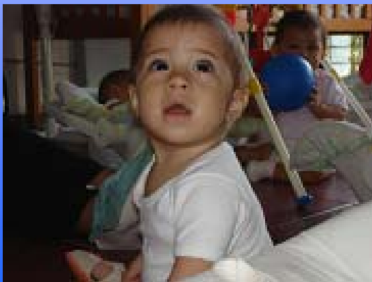
Estancia Infantil Proinfancia de Colima