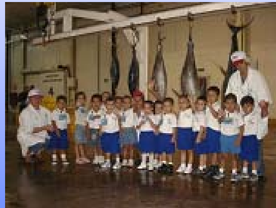
Visita a Planta Industrial Marindustrias 2do. Aniversario de Proinfancia