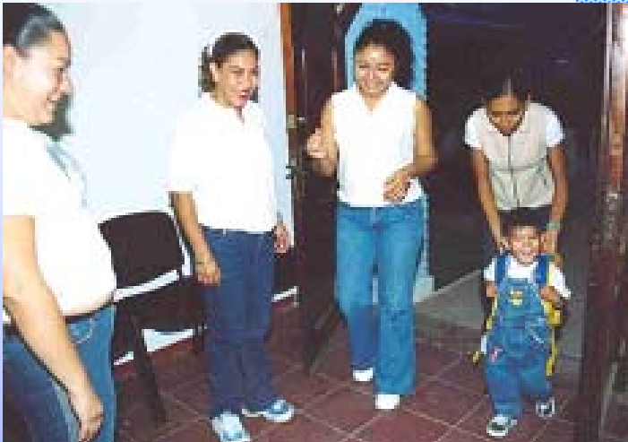
El Primer Ingreso Proinfancia de Colima